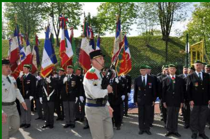
Ci-dessus et à droite, la mise en place