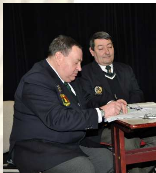
La satisfaction du devoir accompli !