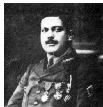
Le Capitaine Sanchez-Carrero

Le capitaine Sanchez-Carrero est tombé à la tête de ses hommes ; 275 légionnaires, dont 10 officiers étaient tués, 1158 dont 15 officiers, étaient blessés, ce chiffre représentait la moitié du Régiment.