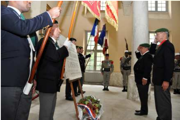
La cérémonie aux Invalides devant la plaque à la mémoire des héros de Camerone