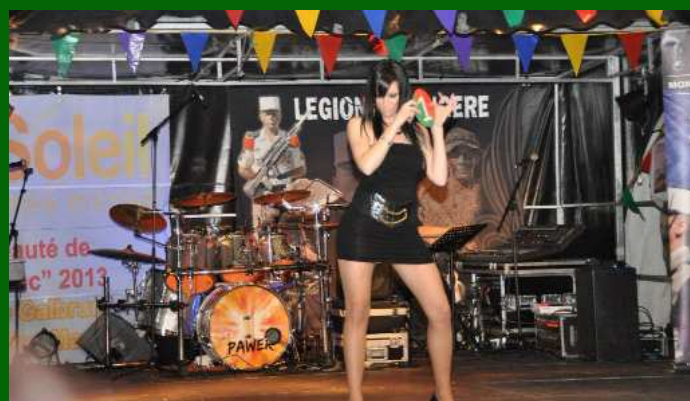
Miss Képi Blanc : Episode 1