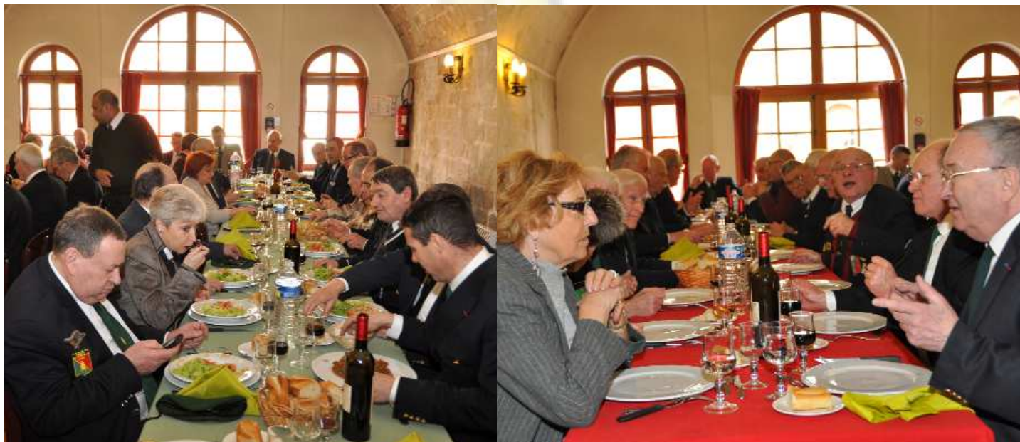
Une assemblée générale placée sous le signe de la convivialité