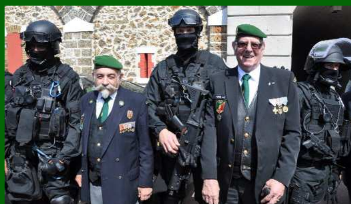
La kermesse, deux inconnus au milieu des hommes de la F.I.P.N.