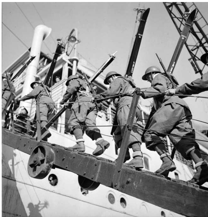
Brest 1940 : légionnaires et chasseurs embarquent pour Narvik

Comment, benjamin de ma promotion et honorablement classé à Saint-Cyr, titulaire d'états de service peu courants, et la plupart de guerre, ne suis-je pas arrivé aux étoiles ? Bien sur