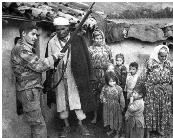
Un harki au cours d'une opération de pacification