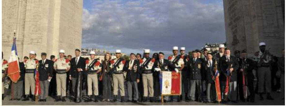
Sous l'Arc de