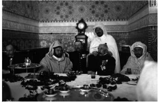
Le résident général de France au Maroc, Lyautey, en 1925, à la table du sultan du Maroc.