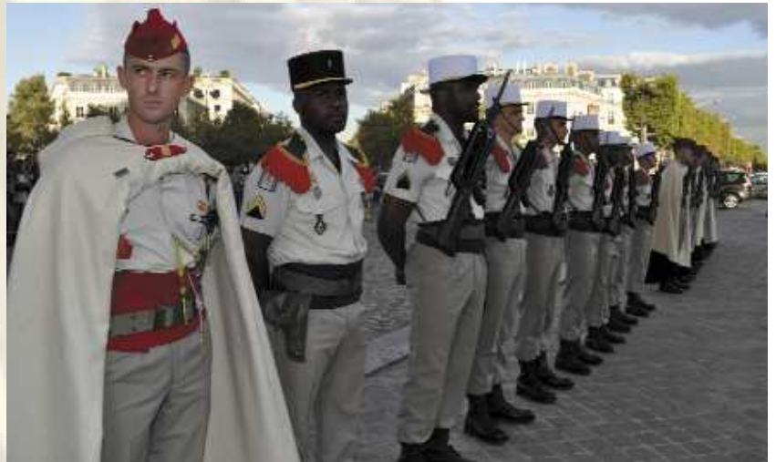
Au fort de Nogent