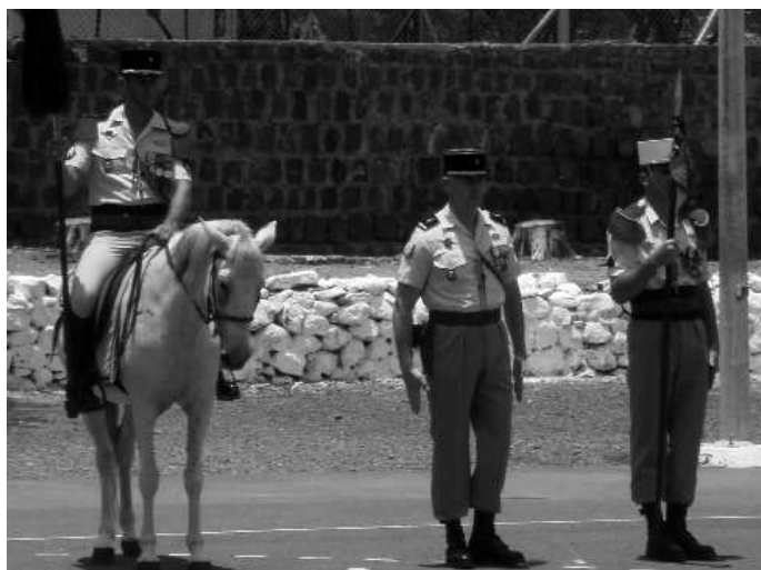
L'escadron de reconnaissance de la "13"

Dans son ordre du jour, il a souligné les liens forts qui ont été tissés en 49 ans de présence entre la 13 ème D.B.L.E. et les djiboutiens. Il a rendu hommage au travail accompli par la 13 ème D.B.L.E. et salué l'œuvre de légionnaires bâtisseurs qui ont construit de nombreux postes et réalisé de nombreux chantiers au profit de la population durant tout leur séjour à Djibouti. Le dernier chantier en date est la construction d'une piste de 800 mètres au mont Gaherre Ghéni qui permet l'installation d'une antenne radio indispensable au dispositif de surveillance des approches maritimes.